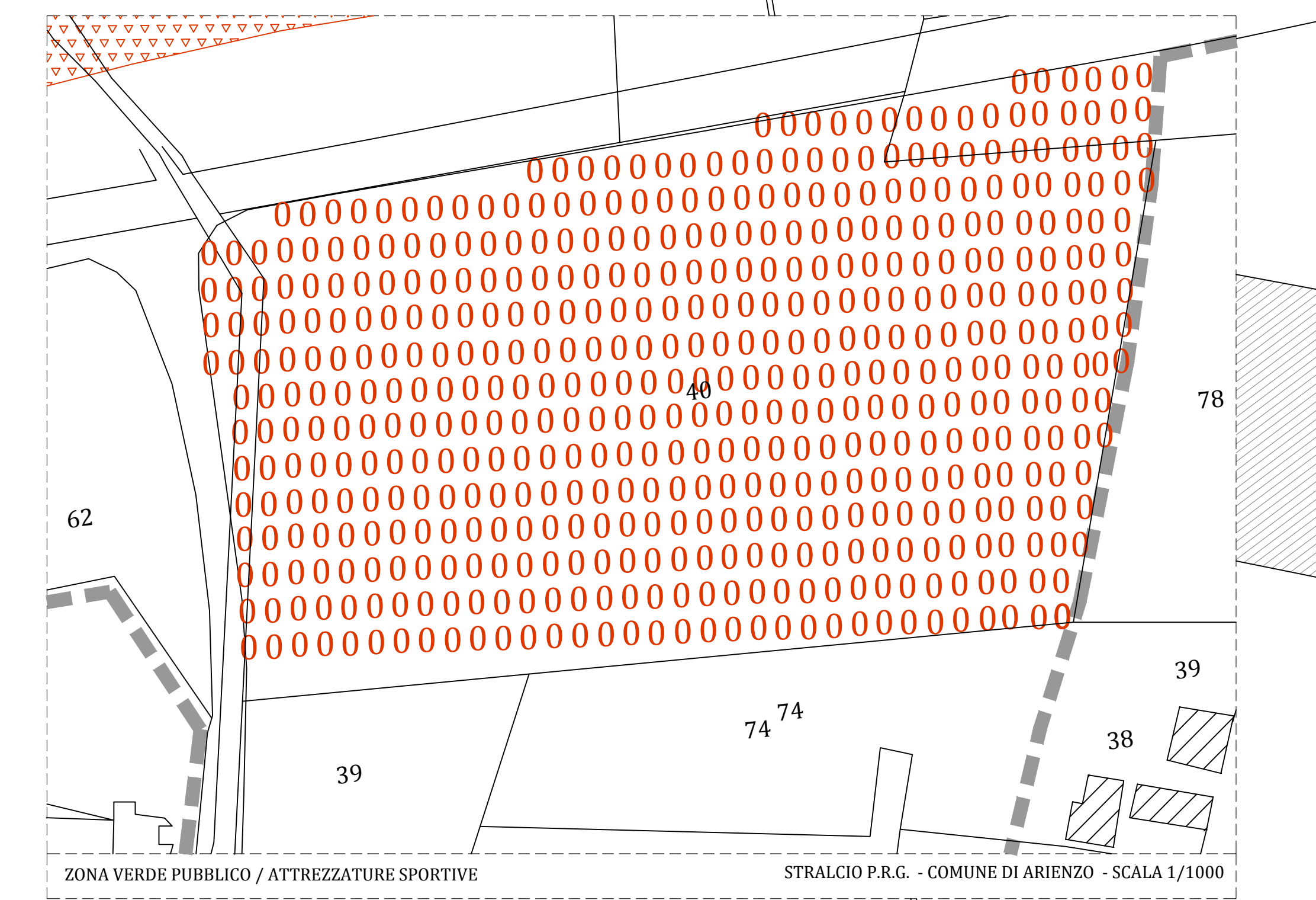
TAV.B04 - TRACCIATURE DI PROGETTO CAMPO DA GIOCO